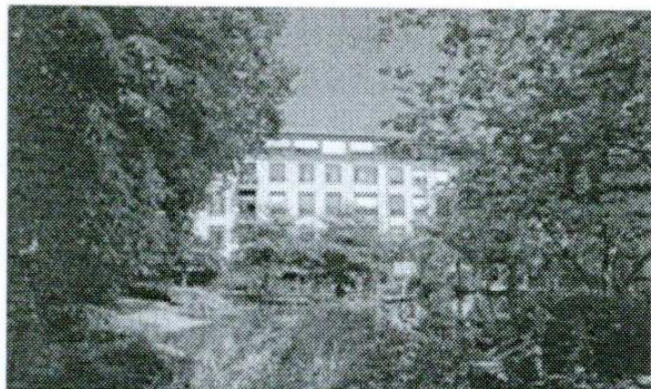
Vor 14 Jahren ging im OP-Saal des St.-Josefshospitals in Uerdingen einiges schief. Leidtragender war Abschir Abdi.